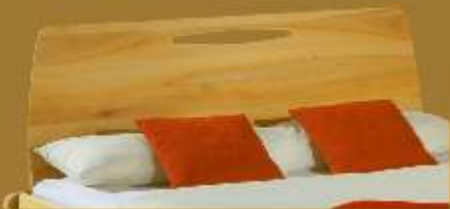
Aufstecklehne schräg Nr. 5

Maße: Kopfteil-Lehne ca. 50 cm hoch, Fußteil-Lehne ca. 30 cm hoch mit geraden Aufsteckmodulen