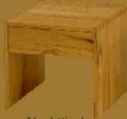
Nachttisch CLUB ca. 42 x 42 x 41 cm