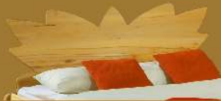
Aufstecklehne schräg Nr. 8