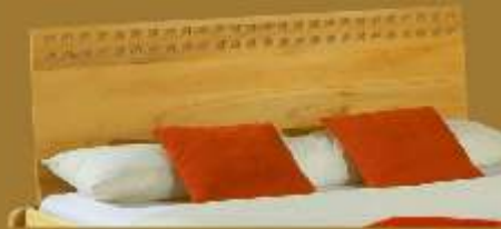
Aufstecklehne schräg Nr. 4