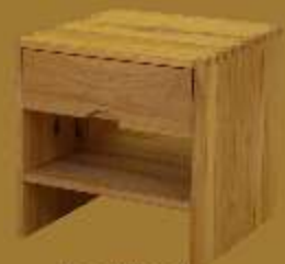
Nachttisch CLUB F ca. 42 x 42 x 41 cm