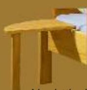
Nachttisch ELLA ca. 35 x 35 x 42/49 cm