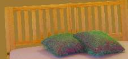
Aufstecklehne gebogen Nr. 9