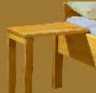
Nachttisch LOUI ca. 35 x 35 x 42/49 cm