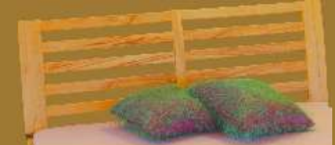
Aufstecklehne gebogen Nr. 10