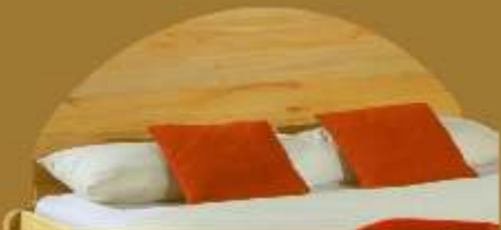
Aufstecklehne schräg Nr. 7