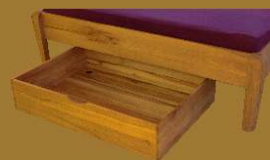
BETTKASTEN ca. 93 x 64 x 19 cm