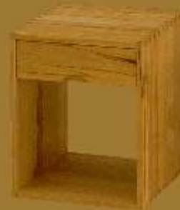
Nachttisch GRANDE CUBO UNO ca. 42 x 42 x 53 cm