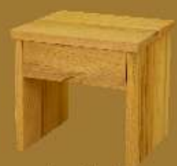
Nachttisch BASIC S ca. 42 x 42 x 41 cm

Holzarten: gedämpfte Buche, Edel-Rotkernbuche, Zirbelkiefer (Arve), Wildeiche oder Schwarznuss (Innenschubkasten konstruktionsbedingt immer aus Buche)