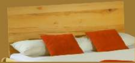
Aufstecklehne schräg Nr. 1