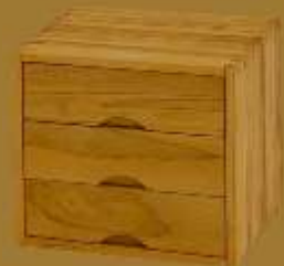
Nachttisch CUBO TRE ca. 42 x 42 x 41 cm