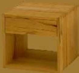
Nachttisch CUBO UNO ca. 42 x 42 x 41 cm