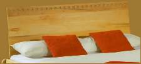
Aufstecklehne schräg Nr. 3