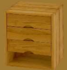
Nachttisch GRANDE CUBO TRE ca. 42 x 42 x 53 cm