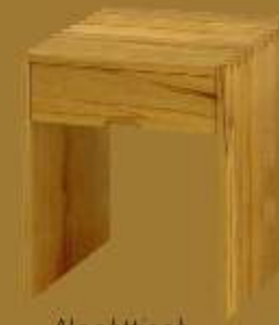
Nachttisch GRANDE CLUB ca. 42 x 42 x 53 cm