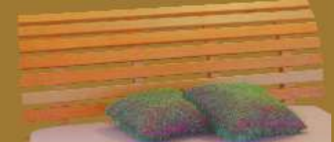
Aufstecklehne gebogen Nr. 12