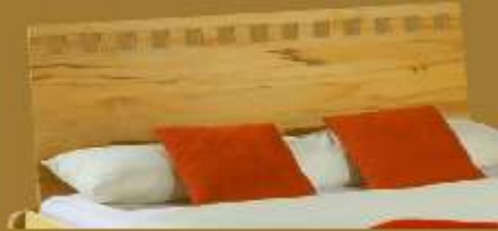
Aufstecklehne schräg Nr. 2