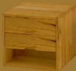
Nachttisch CUBO DUE ca. 42 x 42 x 41 cm