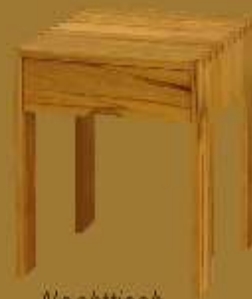
Nachttisch GRANDE EMPORIO ca. 42 x 42 x 53 cm