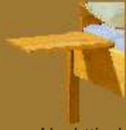
Nachttisch CLICK ca. 35 x 35 cm