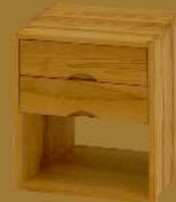
Nachttisch GRANDE CUBO DUE ca. 42 x 42 x 53 cm