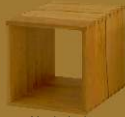
Nachttisch CUBO ZERO ca. 42 x 42 x 41 cm