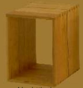
Nachttisch GRANDE CUBO ZERO ca. 42 x 42 x 53 cm