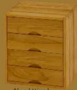
Nachttisch GRANDE CUBO QUATTRO ca. 42 x 42 x 53 cm