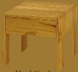
Nachttisch EMPORIO ca. 42 x 42 x 41 cm