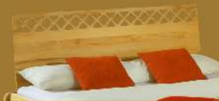
Aufstecklehne schräg Nr. 6