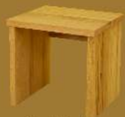
Nachttisch BASIC ca. 42 x 42 x 41 cm