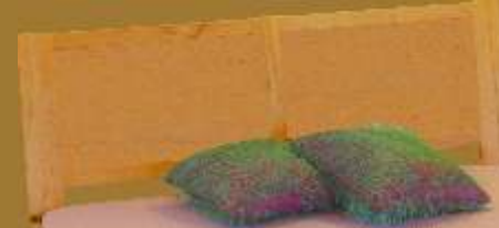
Aufstecklehne gebogen Nr. 11